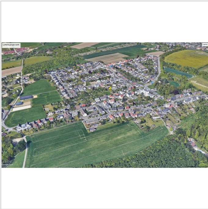
Luftbild mit Objektkenzeichn.

Grundstücksfläche: 511,00 m 2 Kaufpreis: Kauf Kaufpreis: 277.000,00 EUR