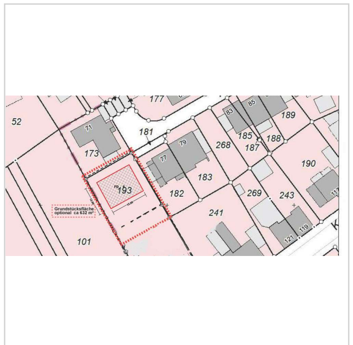
Grundstück optional 632 m 2